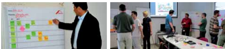
Tényfolyamat elemzés az igazgatóságon Munka 3 teamben a konstrukción

A következő ROS-kerekasztal tapasztalatcserére a területek vezetőivel lapzártánkat követően, szeptember 4-én kerül sor.