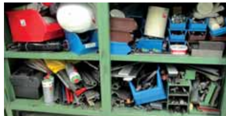
Segédeszközök nem kijelölt helyen való tárolása illetve nem megfelelő tárolása.