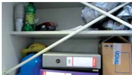
Felesleges tárgyak a munkaterületen.