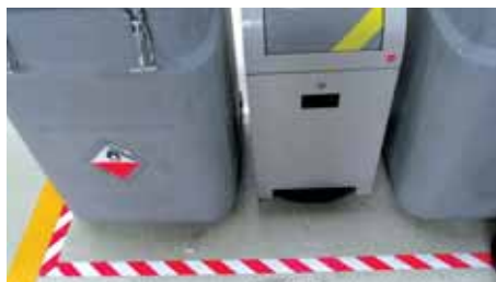
Helytelen 5S alkalmazás