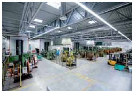
Az új sajtoló területe

Reméljük, hogy a megváltozott struktúrával hosszútávon a gyakorlatban is hatékonyabbá válik a termelésünk.