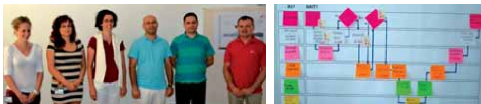
IT és CO folyamatfejlesztő team

Az ROS III. szintjét megkezdő területek azonosították valamennyi őket érintő folyamatukat és azok közül kiválasztottak egyet-egyét, amelyiknél látványos javulást tudnának elérni.