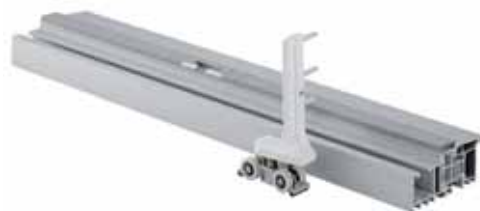
Süllyesztett kivitelű komfort küszöb

guk, ami nagyban elősegíti az energiatakarékosságot. Ugyanakkor az akadálymentes előírásoknak is megfelel DIN 18040, így kerekesszékekkel is könnyedén használható.