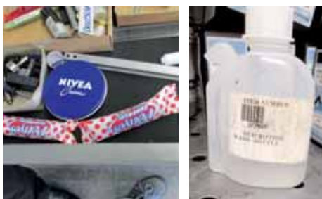
Élelmiszer tárolása, jelöletlen veszélyes anyag tárolása