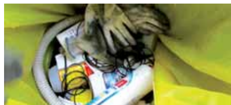
Veszélyes hulladékok nem kijelölt helyen történő gyűjtése, kommunális hulladékok nem megfelelő szelektív elválasztása