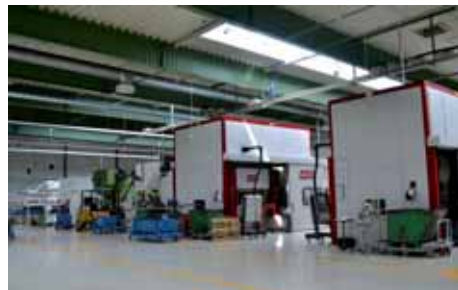
A régi sajtoló területe

Az új sajtoló csarnokban található 9 Brück gép hosszú alkatrészeket gyárt, míg a régi sajtoló csarnokban található többi gépen (4+1 Kaiser, 2 Dimeco, 2 hegesztőgép, vibrációs csiszológép, utánmunkáló sajtológépek) történik a rövid és az esetenként hosszú alkatrészek gyártása.